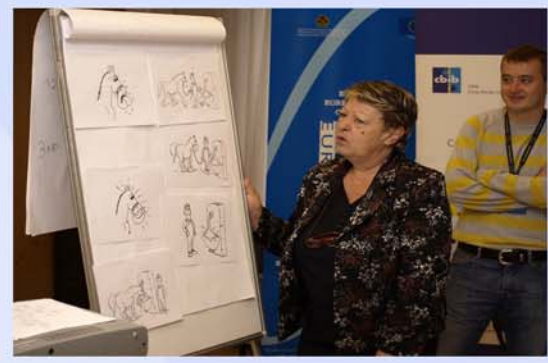
. . . dhe me ndihmën e një 'kali të lumtur (rasti demonstrues në trajnime)' . . .