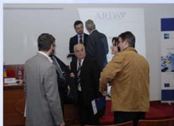
Banja Luka, 18.04.2008