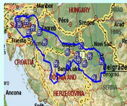
Rajoni i ERSUS

Në periudhën në vijim janë planifikuar trajnime e seminare me synimin për të edukuar individët se si të aplikojnë në fondet e IPA-s e të realizojnë projekte konkrete.