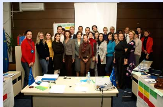
. . . gati për sfidat e Thirrjeve për Propozime që shpejt do vijnë!