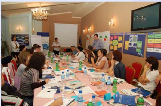
. . . nëpërmjet punës në grup dhe konsultimeve . . .