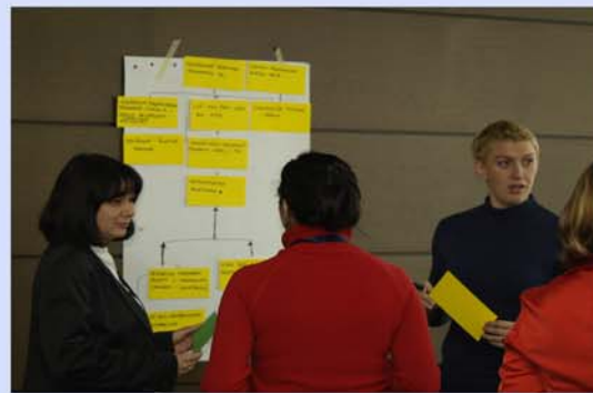
. . . nëpërmjet shkëmbimesh dhe diskutimesh . . .