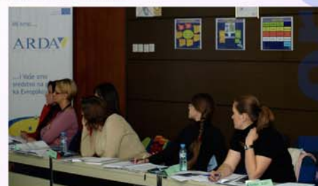
Trajnime mbi përgatitjen e projekteve, organizuar nga CBIB dhe ARDA, 22-23 shtator, 2008, Banja Luka

Në kuadrin e përgatitjes së vendeve të Ballkanit Perëndimor për përdorimin e fondeve evropiane (IPA komponenti II, Bashkëpunimi Ndërkufitar), në bashkëpunim me projektin rajonal CBIB, ne morëm pjesë në organizimin e info days (ditëve të informacioni), në prezantime e trajnime. Më shumë se 200 vetë nga rajoni veriperëndimor i Bosnjës dhe Hercegovinës morën pjesë në trajnime në lidhje me përgatitjen e projekteve në bazë të kërkesave të Komisionit Evropian.