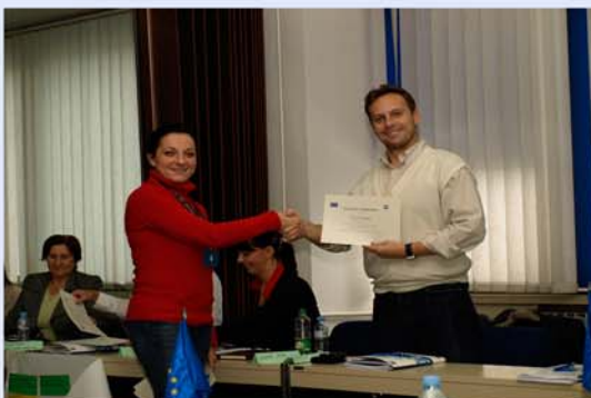
. . . të gjithë ia dolën mbanë me sukses në fund . . .