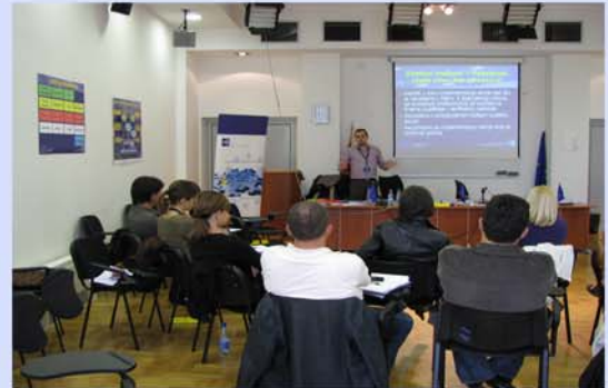
Nën syrin e kujdesshëm të trajnuesve . . .

Me përgatitjen dhe miratimin e programeve dhe me vendosjen e strukturave të menaxhimit, CBIB ndërmori një detyrë të rëndësishme për të përgatitur ata që do të jenë përfituesit përfundimtarë potencialë të fondeve të IPA CBC që të marrin pjesë me sukses në thirrjen për propozime që do të lançohet së shpejti. Pasi aplikantët potencialë u informuan për mundësitë e financimit në bazë të IPA CBC gjatë fushatës së ndërgjegjësimit, CBIB organizoi 18 sesione 2 ditore trajnimi për rreth 600 aplikantë potencialë në Rajon.