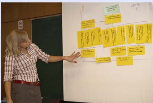
... со неколку сомнежи и нејаснотии...