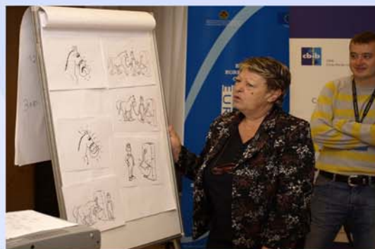
... и со помош на "среќниот коњ" ...