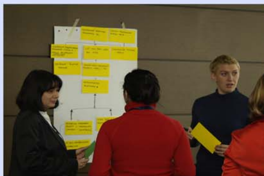
... преку резимирање и дискусии...