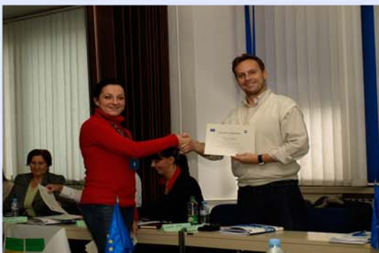
... сите успешно стигнаа до целта ...