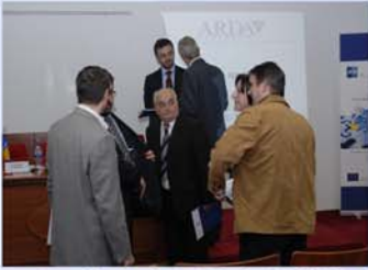
Banja Luka, 18.04.2008