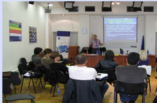
Под будното око на обучувачот...

Кога програмите ќе бидат подготвени и одобрени, а управувачките структури поставени, СВБВ ќе има важна задача да ги подготви оние кои ќе бидат потенцијални крајни корисници на фондовите за ИПА ПС за успешно да учествуваат во претстојните Повици за доставување предлози. Откако потенцијалните кандидати беа информирани за можностите за финансирање под ИПА ПС за време на информативната кампања, СВБВ организираше 18 дводневни обуки за околу 600 потенцијални кандидати од регионот.