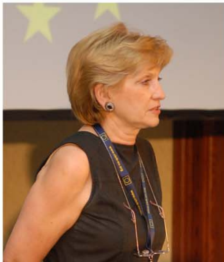
СВІВ: Каково е значењето на прекуграничната соработка за интеграцијата на Србија во ЕУ?

Г.Л.: Значењето на прекуграничната соработка за интеграција во ЕУ е големо. Прво, Србија добива дополнителни средства со кои може да ја прошири и зајакне соработката со своите соседи, кои во исто време се и нејзини најважни економски партнери, да ги обнови сите видови на соработка меѓу локалните заедници, било да се тоа органи и институции на локалната самоуправа или граѓански организации. Тоа претставува индиректно финансиско јакнење на граничните области кои, по правило, се релативно послабо економски развиени поради близината на границата.